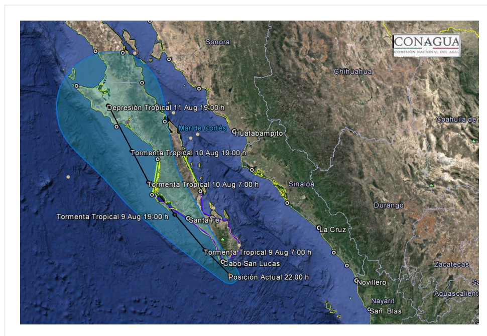
Trayectoria pronostico de la tormenta tropical JAVIER